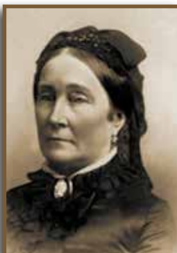
Egy világhírű pezsgő nagyasszonya, Louise Pommery

A pezsgő elterjedését jelentős mértékben elősegítették a napóleoni háborúk. Különben is a háborúk a pezsgőfogyasztást növelték. A szövetkezett hatalmak hadseregei 1814-ben, amikor Franciaországban voltak, átvonultak Champagne-on, és az ottani pezsgók tartalmát nagyon alaposan „tanulmányozták”. A finom italt sokan megismerték, és annyira megkedvelték, hogy a háború befejezése után hazájukban is megkívánták. Ennek hatására hatalmas rendelések keletkeztek Európa-szerte, ami a fogyasztás elterjedését hihetetlen mértékben növelte.