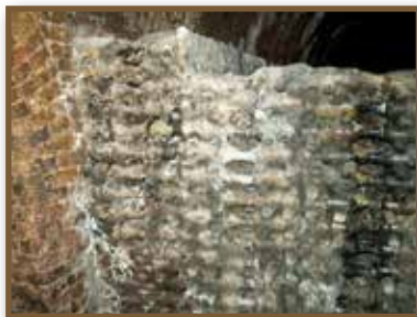
Pezsgők érlelése, tárolása

Tökéletesen hiszem, hogy Littke úr e minden tekintetben pompás és a pécsi házibálok történetében epochát csináló multságért, mellyel pangó tár-