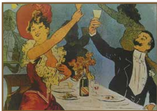
Pezsgő, az orfeumok kedvenc itala

Olyan szempontból sem érdektelen a felsorolást áttekinteni, hogy ebből a vetületből is értékelni tudjuk Littkéék zseniális üzleti érzékét, szakmai tudását.