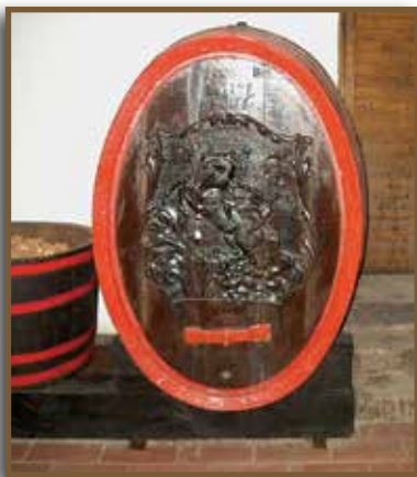
Díszes faragású boroshordó

Littke József nem elégedett meg az elért pezsgőkészítési módszerrel, egyre újabb és újabb fejlesztéseket, technológiákat vezetett be. Francia gyártmányú likőröző-ésdugaszógépeket hozatott. Bevezette a fagyasztásos (degorzálás) seprő eltávolítási eljárást.