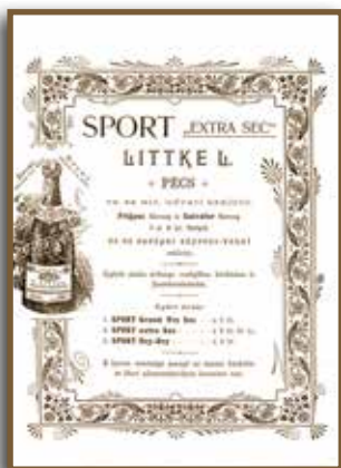
1893. A Littke Sport pezsgő reklámkártyája