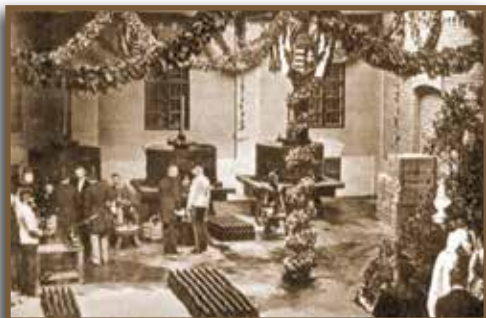
I. Ferencz József látogatása a Littke-pezsgőgyárban

1890. május 23-án a bécsi kiállításon őfelsége I. Ferencz József király is megtekintette a Littke-pezsgőgyár pavilonját.