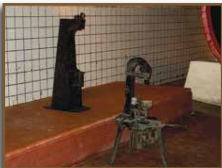
A pezsőkészítés eszközei 2.