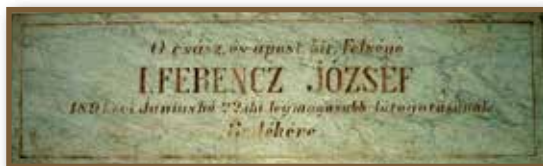
A császári látogatás emléktáblája

1891. június 22-én nagy megtiszteltetés érte Littke József pécsi pezsgőgyárost. I. Ferencz József, „ő császári és apostoli királyi felség” Pécsre látogatása alkalmával látogatásával tisztelte meg üzemét. Kíséretében ott volt Frigyes főherceg és az akkori politikai élet több méltósága is.