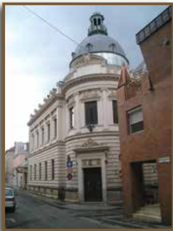
Kereskedelmi és Iparkamara (1893. terv: Kirstein Ágoston)