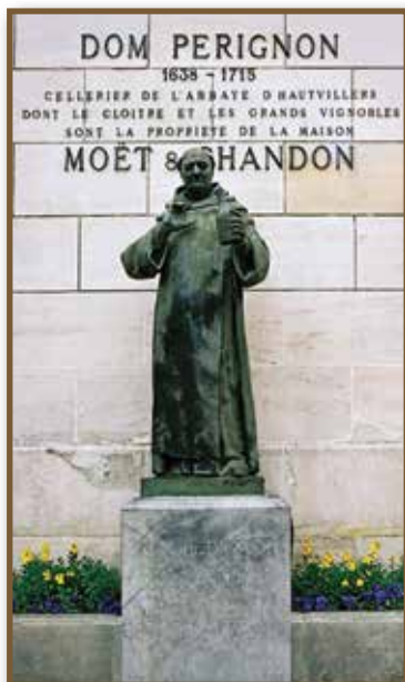
Dom Perignon (1638–1715), a pezsgő megalkotója

Mikor a gyöngyöző bort Dom Perignon megkóstolta, a legenda szerint így kiáltott fel: „A csillagokat iszom!”