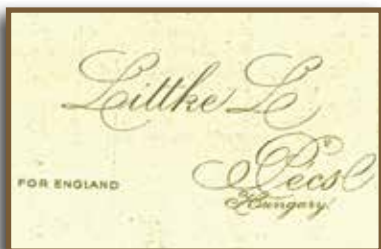
Littke For England pezsgőjének címkéje

Eredményes tárgyalásokat folytatott különböző pécsi befektetőkkel, minek eredményeként 1934. november 29-én létrejött a „Littke Pezsgőgyár Vezérképvisellete Kft.”