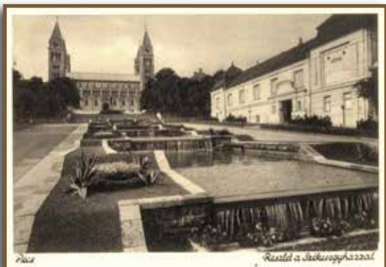
A Littke-pezsőüzem az 1930-as évek végén

pezsőgyáros tehetségén múlt, hiszen nagyot fordult száz év alatt a világ. Jelentősen megváltozott a gazdasági és társadalmi légkör, amely mind-mind hozzájárult annak idején a Littke-ősök sikereihez. (III.) Littke József életéből sem hiányozhatott a klasszikus franciaországi tanulmányút (Epernay, Reims).