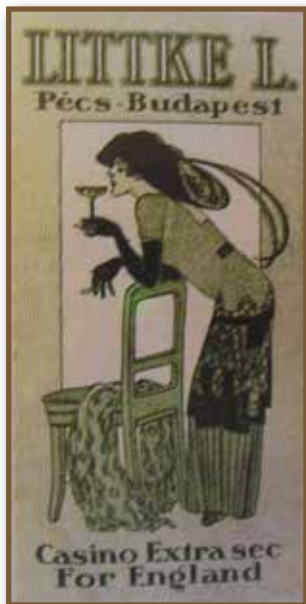
Littke pezsgő (For England) reklám