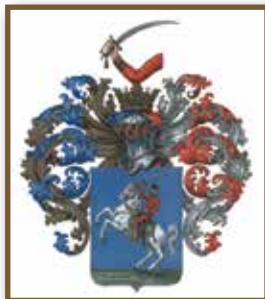
A Littke család címere

1912. április 27. A Littke család magyar nemességet kapott a királytól „Lőrincbányai” előnévvel. (Ezt az előnevet a pécsbányatelepi, egykori Littke tulajdonban lévő szénaknákról kapta a család.)