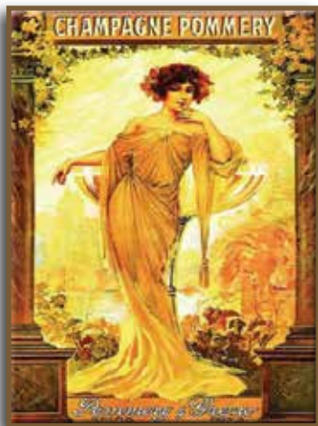
A Pommery pezsgő címkeje

Sajnos az adaptáció nem volt sikeres. A francia pezsgőgyártási technológia a kezdetekben ugyancsak nagy gondokat okozott a Littke családnak, de kitartó szorgalommal és kockázatvállalással nem mondtak le a kitűzött célról, és a múltó idő őket igazolta. A Littke-pezsőgyárat a tradicionális francia pezsgő készítése tette naggyá és emelte Európa élvonalába.