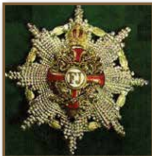
A Ferencz József lovagrend érdemkeresztje