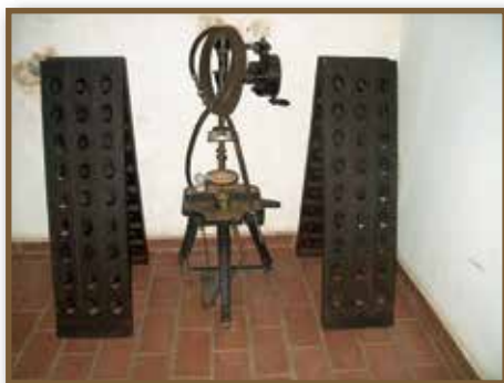
A pezsgőkészítés eszközei 1.

A kezdetek után, 1865-ben a francia módszert kívánták alkalmazni a pezsgőkészítés terén. Sajnos a módszer bevezetése korainak bizonyult. A pécsi adaptáció meglehetősen szerencsétlenül sikerült, melynek során a Littke-társulást jelentős anyagi kár érte.